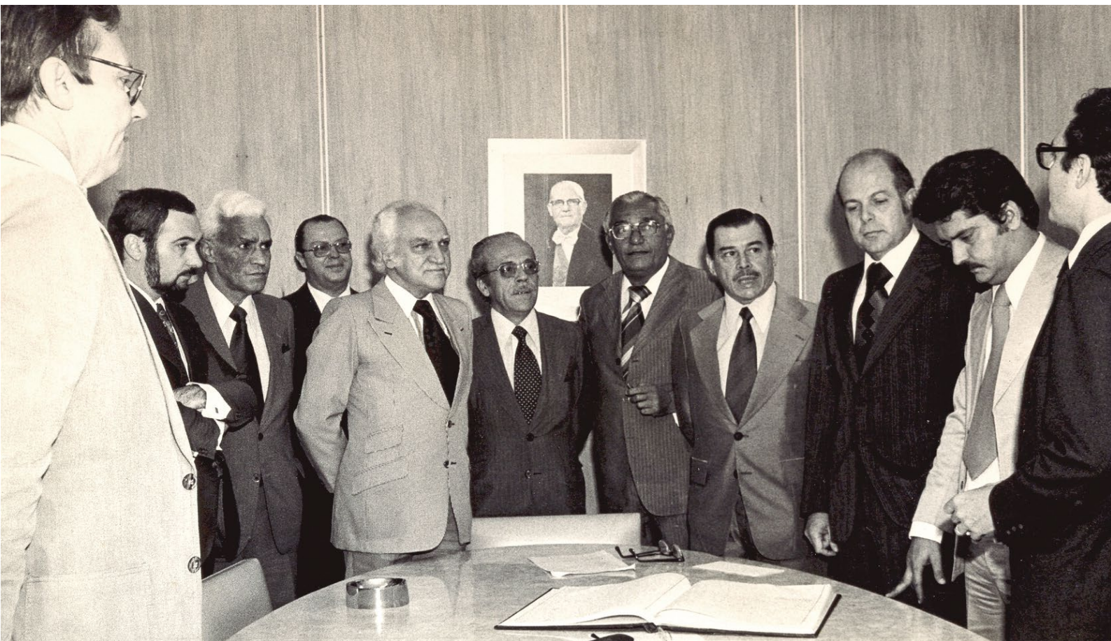
Cerimônia que marcou a implantação da Funcef em 1977

Tudo foi possível virar realidade com maior participação de todos. Na atual conjuntura nacional, em que a ameaça de privatização da Caixa volta à tona e se tenta impor mudanças unilaterais na Funcef, a Fenaes tem certeza de que é preciso aglutinar forças em defesa da Caixa, da democracia e dos direitos.