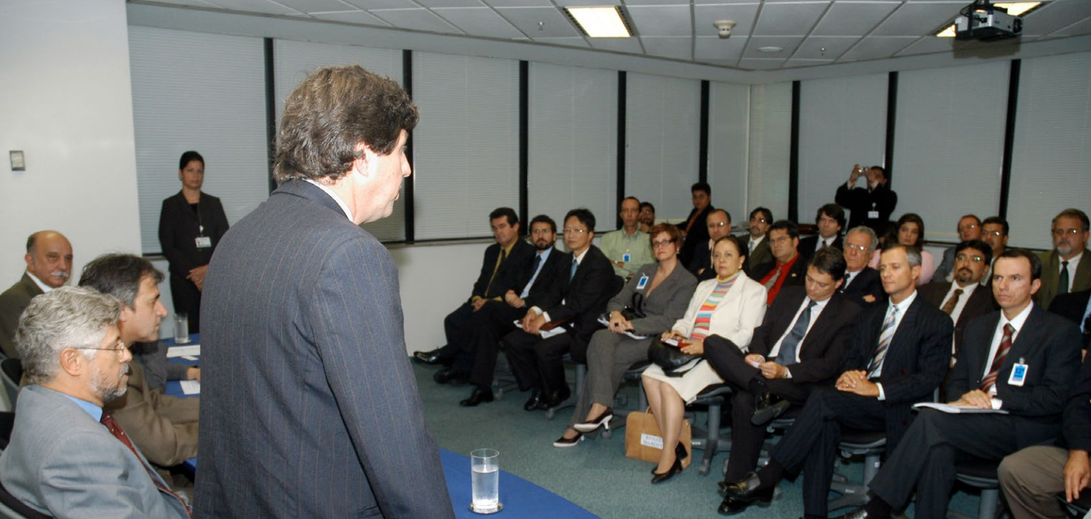
Solenidade de instalação do GT do novo Estatuto da Funcef - 2006